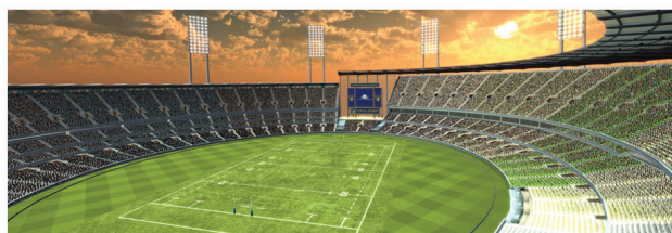
Environnements de stade réalistes

eM eMotionLabs.fr Conception, Location, Vente de simulateurs