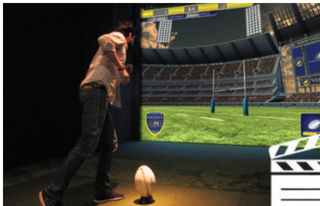
Essayez-vous au drop !