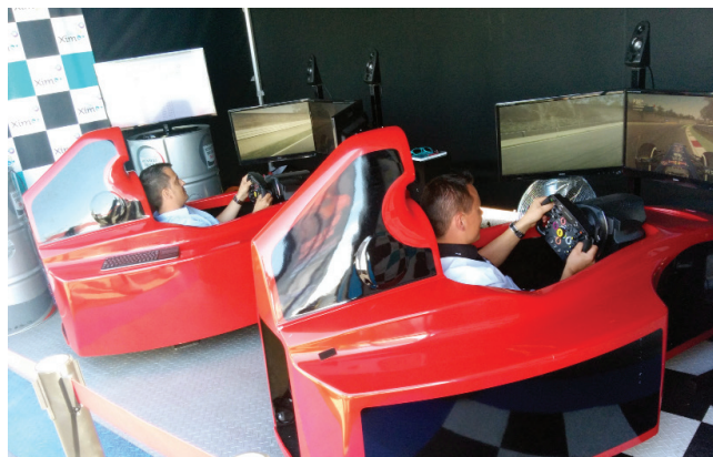
Demi Cockpits de Formule 1 sur véris électriques !

Votre contact : gwenael EHANO au 09 72 55 94 47