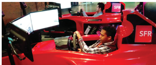
Duel de pilotes