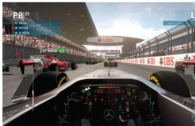
Simulation Formule 1 réaliste