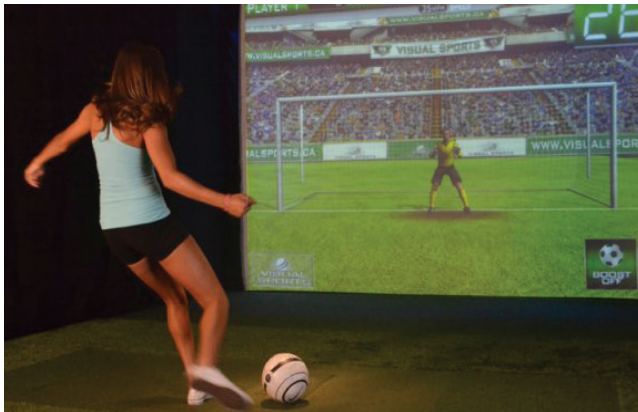
La France accueillera la coupe du Monde féminine en 2019