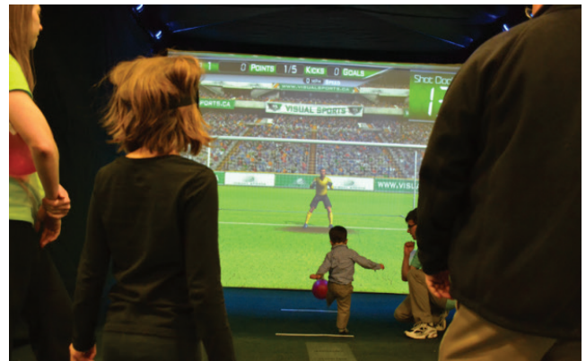
Pour tous publics et à tous les âges !

Votre contact : gwenael EHANO au 09 72 55 94 47