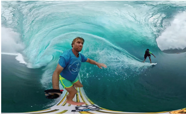
Animation Surf présente au Bordeaux Surf Festival

L'animation est tous publics, Effet WOW garanti.