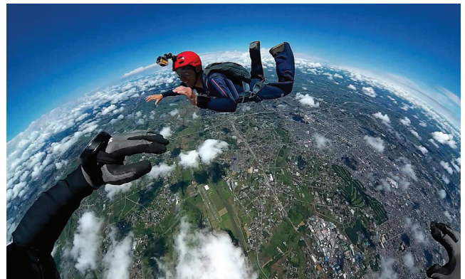
Prenez de la hauteur : chute libre et parachute