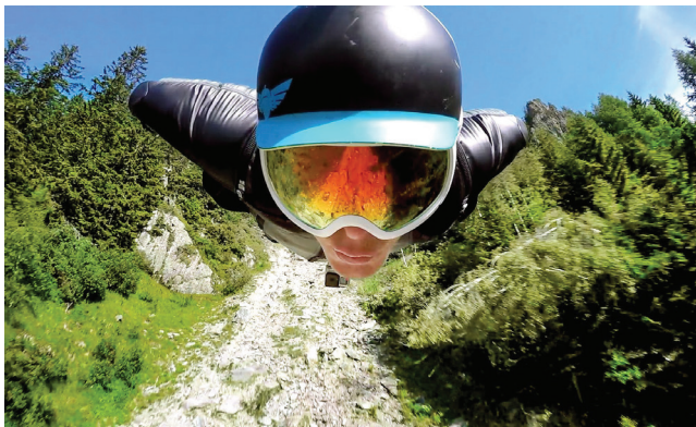
Osez le WingSuite, une poignée de secondes à vitesse folle, sans autre artifice qu'une combinaison