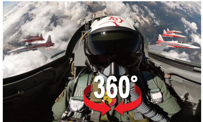
Rejoignez l'escadrille et vivez les acrobaties d'un pilote de l'air